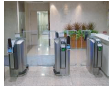
入口写真 (入場ゲート連動)