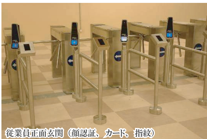
従業員正面玄関 (顔認証、カード、指紋)